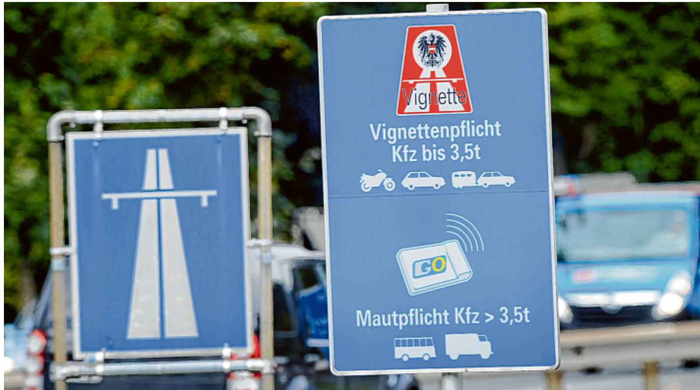
Die Vignettenpflicht für Autobahnen wird regelmäßig kontrolliert.