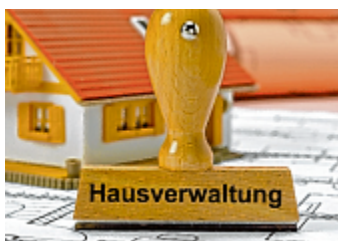
Schwarze Schafe schaden dem Ruf der Branche.

PS: Damit andere unzufriedene Hausgemeinschaften nicht das gleiche Schicksal erleiden, wird im immobilien.blog umfassend darüber informiert, wie man eine Kündigung rechtlich durchführt.